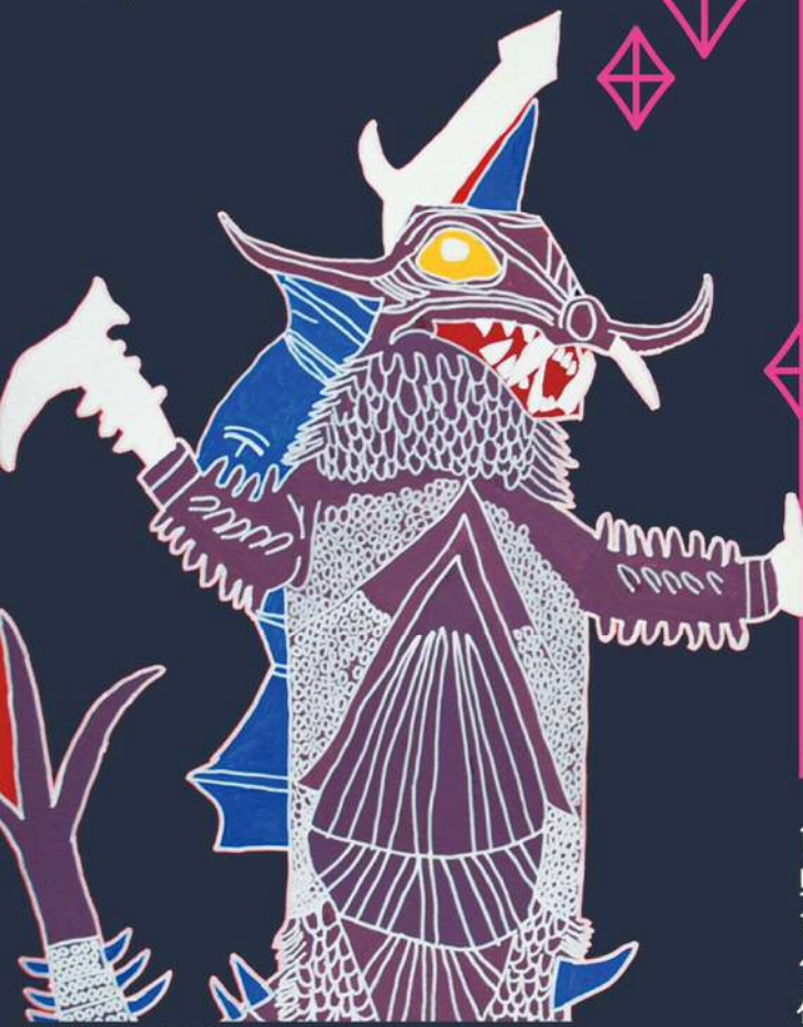
辻 泰羊「ゴモラ and バラバ」より

平成 28年 12月 9日(金) ~ 11日(日) 〔美術・文芸作品展は12月3日(土) ~ 11日(日)〕