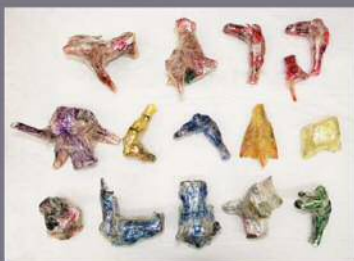
テ オブジェ 奈良朋紀