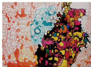
自 絵画 阿部来未