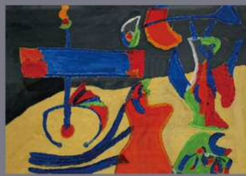
「ふしぎなサーカス」