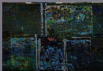
自 絵画 古波藏あゆみ