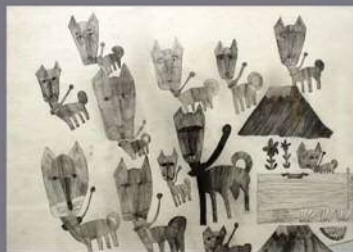
テ 絵画 浅井智之