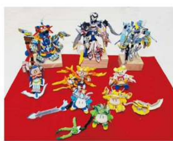
自 オブジェ 山本和矢