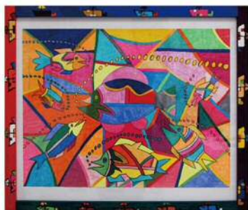
自 絵画 青山典生