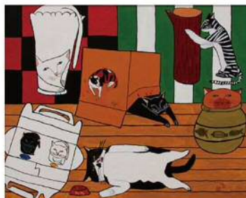
自 絵画 平澤広大