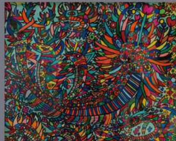
自 絵画 深津敦史