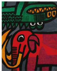
「キバ大きいマンモスとワニ」