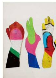
「グーチョコキバー」