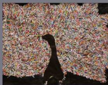
自 絵画 高浜市立翼小学校 特別支援学級