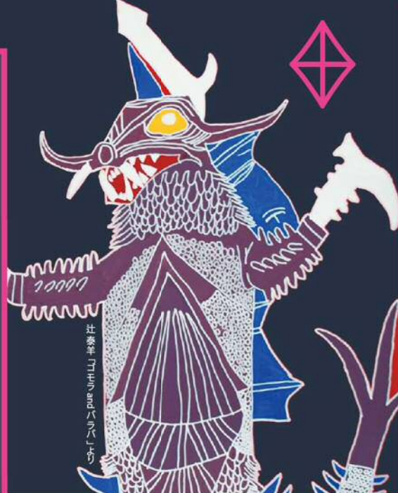
社団法人アール・ブリュット