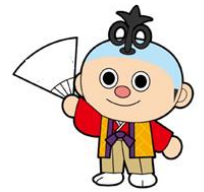
大会マスコットキャラクター からくりロボットの“ブンソー”