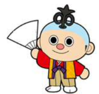
大会マスコットキャラクター からくりロボットの“ブンゾー”